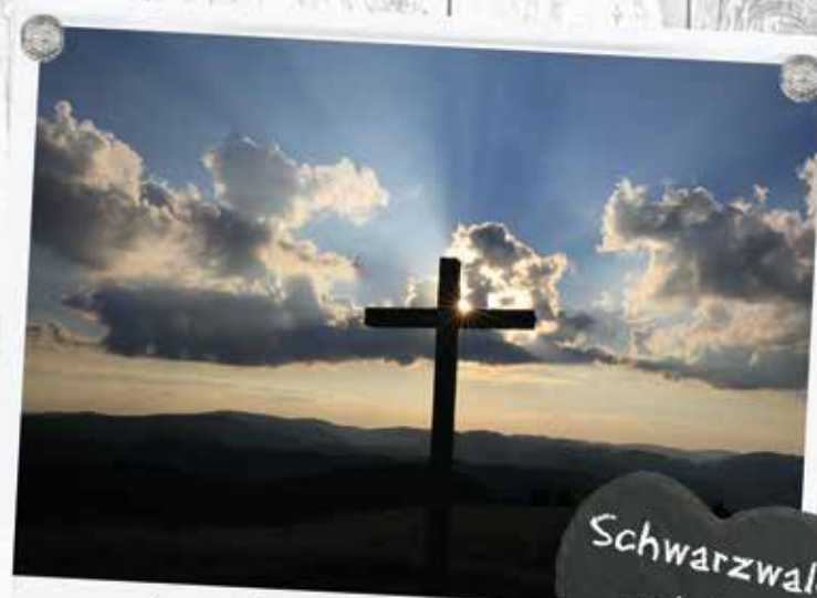
...schön hier oben!